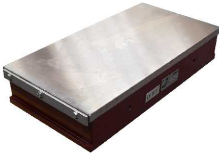
Placa eletromagnética 600x300 mm