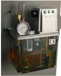
Unidade de lubrificação