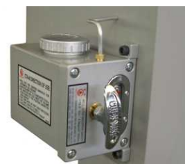
Bomba de lubrificação