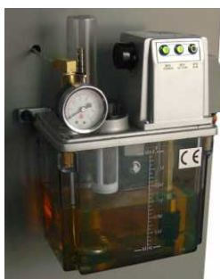
Unidade de lubrificação