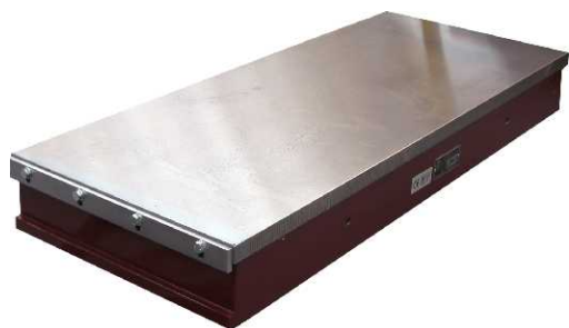
Placa eletromagnética 1000x400 mm