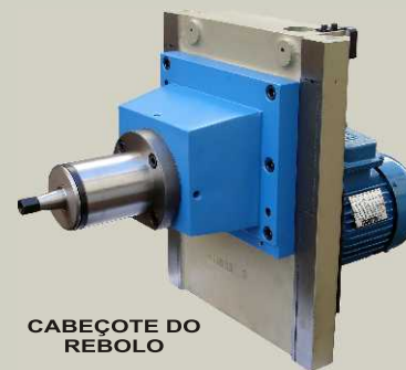
CABEÇOTE DO REBOLO