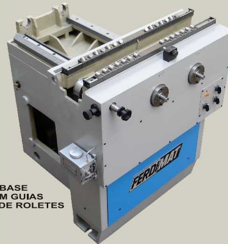
BASE COM GUIAS LONG. DE ROLETES