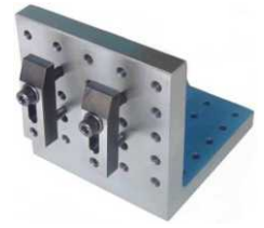
COD: 133003-9 Luneta 2 pontos Ø máx. 50mm