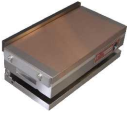
COD: 069055-4 Placa de senos 150x300mm c/fixação magnética 1 plano