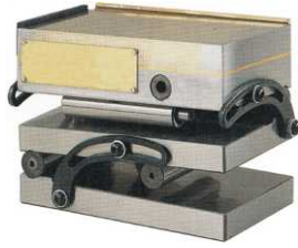
COD: 069035-0 Placa de senos 150x300 mm c/fixação magnética 2 planos