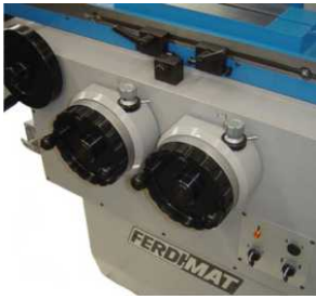
COD: 163001-6 Avanço transversal e vertical micrométrico