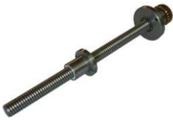
COD: 179001-3 Fuso de esferas para movimento vertical