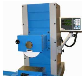
COD: 154003-3 Leitura digital