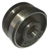
COD: 115001-4 Flanges adicionais