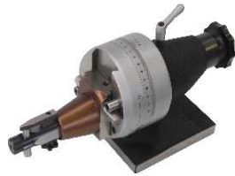
COD: 069033-3 Diamantador de raios e ângulos combinados