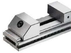
COD: 069021-0 Morsa de precisão larg. 73x90 mm comp.